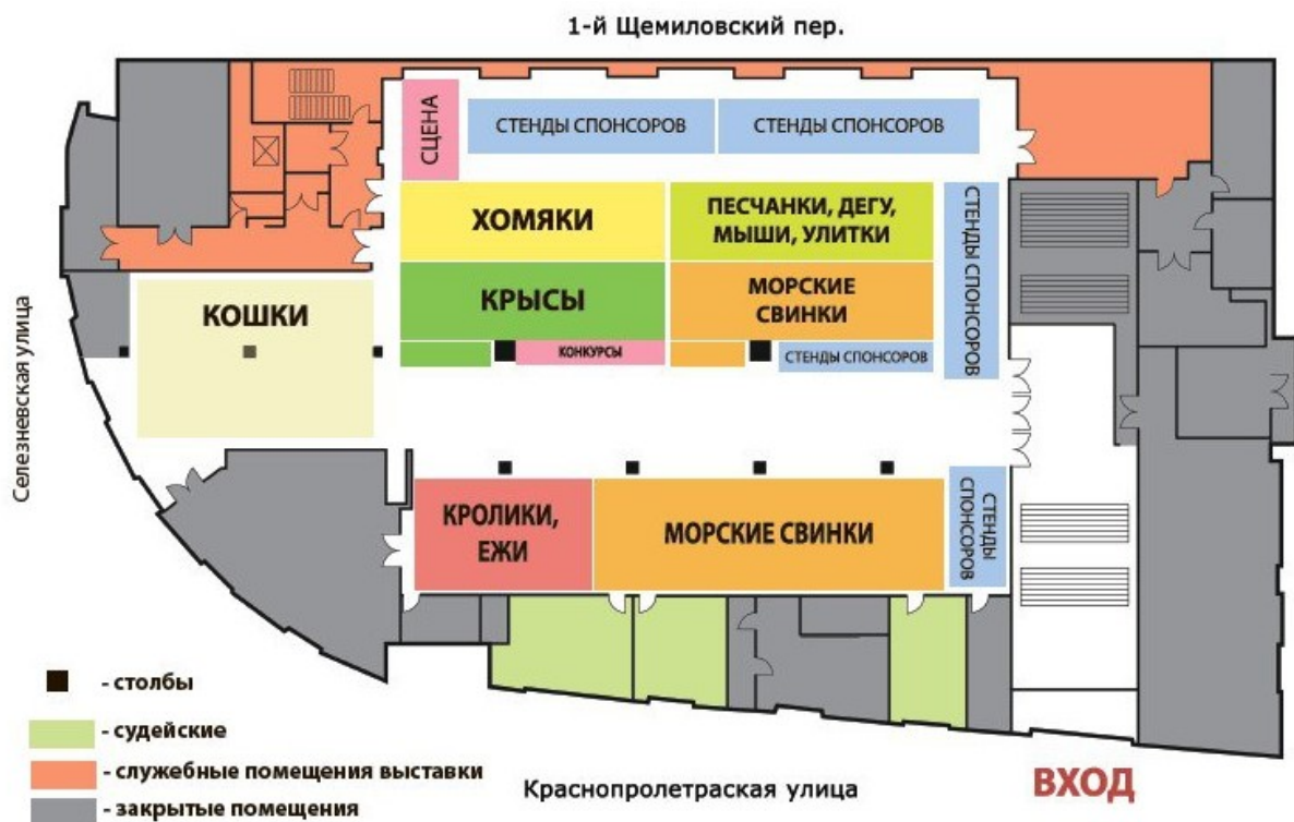
Схема расположения секций на примере выставки «ЗооПалитра» ® . Осень 2015

МА «Родемакс» организовало первую выставку «Зверек на ладошке» ® в мае 2005 года. Тогда ее участниками стали владельцы маленьких домашних животных, таких как крысы, хомяки, мыши, песчанки и дегу. Со временем к ним присоединились владельцы морских свинок, шиншиллы, птиц, экзотических животных. В процессе закономерного расширения и дальнейшего развития Зоошоу «Зверек на ладошке» ® стало частью выставки животных «ЗооПалитра» ® .