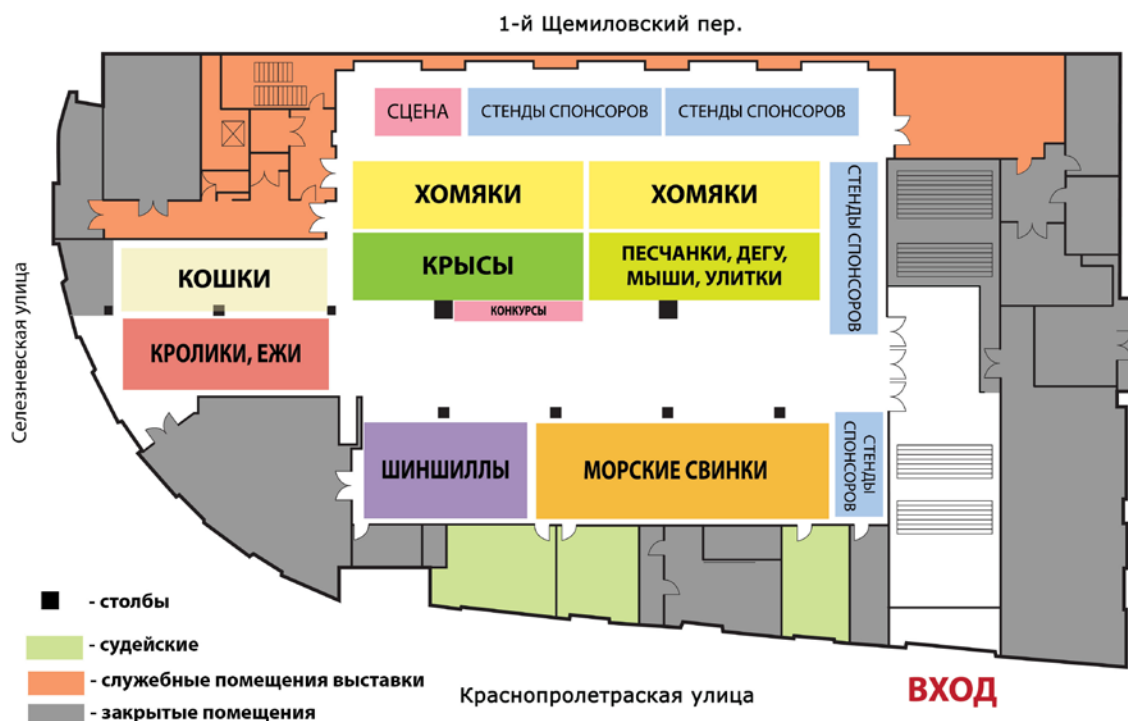
Схема расположения секций на примере выставки «ЗооПалитра» ® . Весна 2016

МА «Родемакс» организовало первую выставку «Зверек на ладошке» ® в мае 2005 года. Тогда ее участниками стали владельцы маленьких домашних животных, таких как крысы, хомяки, мыши, песчанки и дегу. Со временем к ним присоединились владельцы морских свинок, шиншиллы, птиц, экзотических животных. В процессе закономерного расширения и дальнейшего развития Зоошоу «Зверек на ладошке» ® стало частью выставки животных «ЗооПалитра» ® .